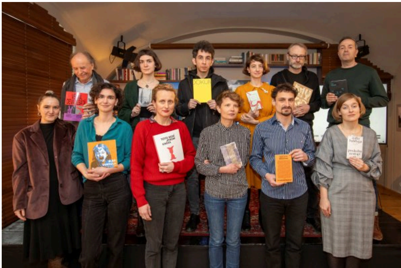
Někteří z nominovaných na letošní ceny Magnesie Litera.