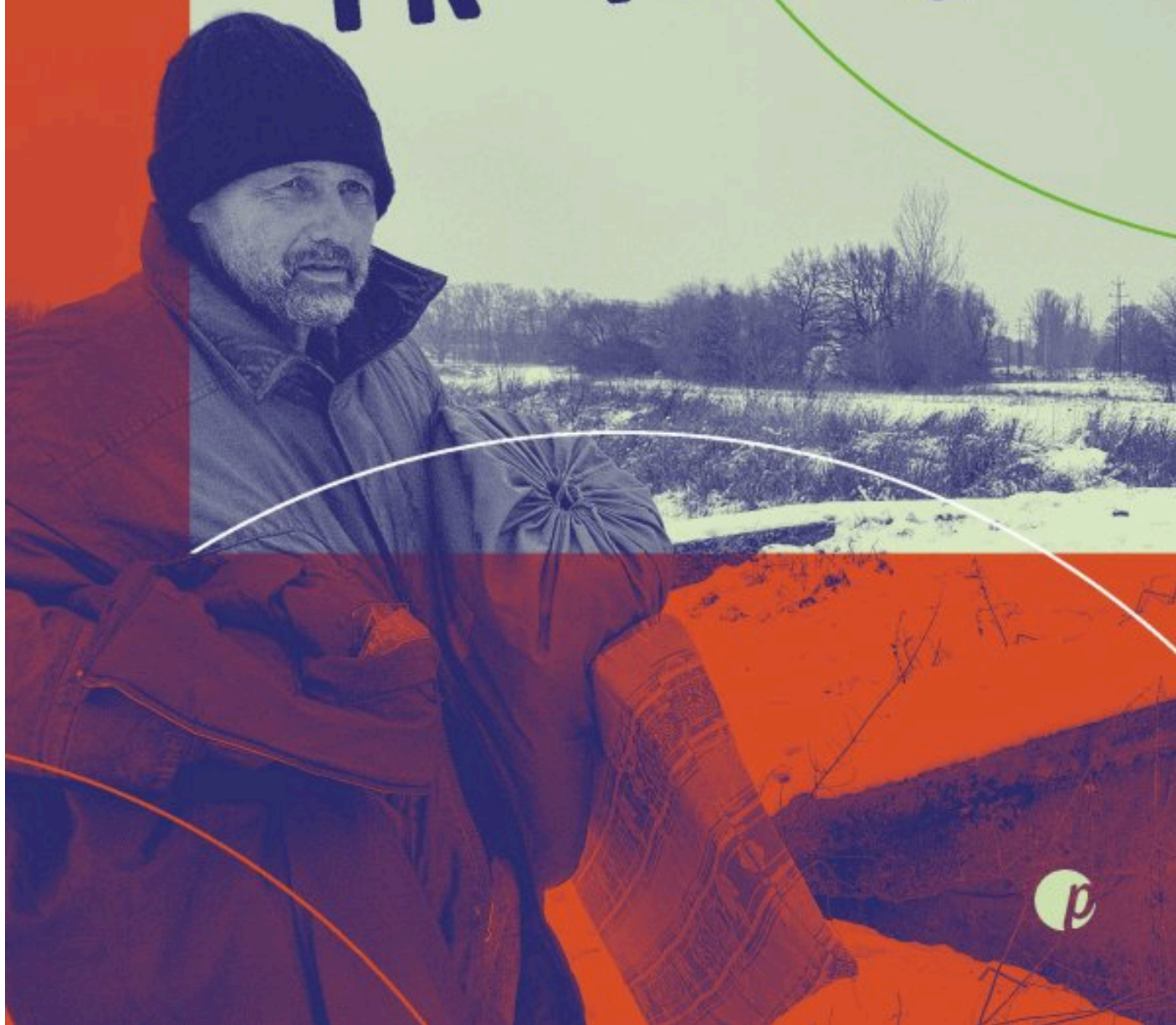
Třetí most.